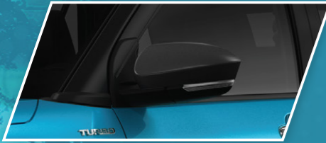
ຕາໄຟດ້ານຂ້າງປັບດ້ວຍລະບົບໄຟຟ້າ Outside Rear View Mirror With Electric Adjustable