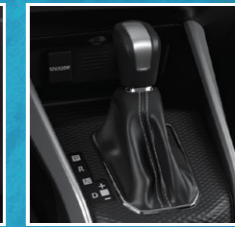
ລະບົບເກຍ CVT CVT transmission