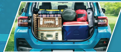
ພື້ນທີ່ເກັບເຄື່ອງສຳພາລະດ້ານຫລັງທີ່ກວ້າງຂວາງ A wide trunk space for each and every one of your stuffs