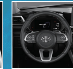
ລະບົບປ່ຽນເກຍກະປຸກ ເທິງພວງມະໄລ Paddle shift