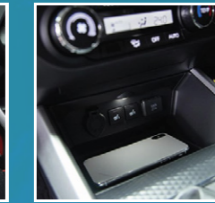
ຖາດຄອນໂຊນຫນ້າພ້ອມ ໄຟ LED Front console tray (with LED light)