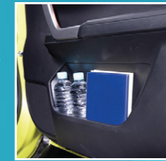
ຊ່ອງໃສ່ເຄື່ອງ/ຕຸກນ້ຳ ດ້ານຫນ້າທາງຂ້າງ Front door pocket & bottle holder (two plastic bottles)