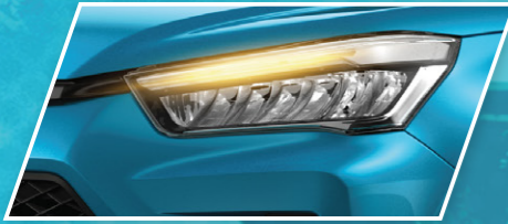
ຕາໄຟໜ້າ LED ແລະ ໄຟລັຮຽບແບບລະບົບແລ່ນ Hi LED Headlamp & Sequential Turning Lamp