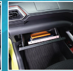
ກ່ອງໃສ່ເຄື່ອງດ້ານຫນ້າ Glove box