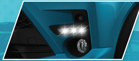
ໄຟແລ່ນກາງເວັນ LED ແລະ ໄຟຕັດຫມອກ ດ້ານໜ້າ Daytime Running Light & Fog Lamp