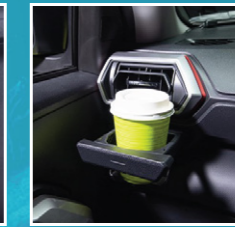
ປ່ອນຮອງຈອກນ້ຳຄົນຂັບ & ຜູ້ໂດຍສານດ້ານຫນ້າ Cup holder (driver & passenger)