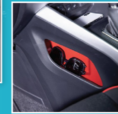
ຊ່ອງໃສ່ເຄື່ອງຂ້າງດ້ານຫນ້າ Center console side pocket (driver & passenger)