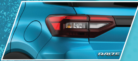
ຕາໄຟດ້ານຫລັງ LED LED Rear Combination Lamp