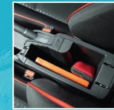
ກ່ອງໃສ່ເຄື່ອງດ້ານກາງ Center console box