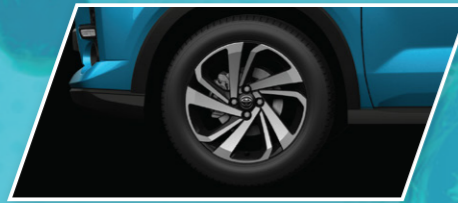
ລໍ້ແມັກຂະໜາດ 17 ນິ້ວ 205/60R17-AL