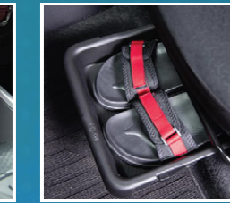
ຖາດວາງເຄື່ອງຜູ້ໂດຍສານ Passenger seat under tray