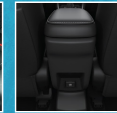
Port ຮຽບ USB ດ້ານຫລັງ Rear USB port