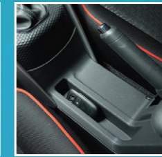
ກ່ອງໃສ່ເຄື່ອງທາງກາງ ດ້ານຫນ້າ Console inner tray