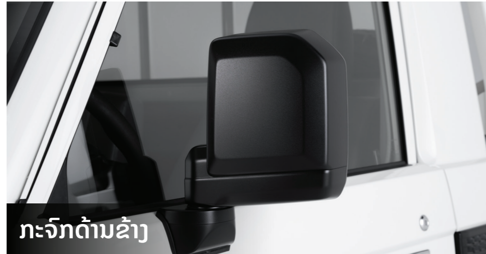
ກະຈົກດ້ານຂ້າງ

ໄຟຕັດໝອກແບບ LED ດ້ານໜ້າ ຊ່ວຍໃນການຂັບຂີ່ໃນເຂດມີໝອກ ແລະ ພື້ນທີ່ພູສູງ. ຮັບປະກັນການເບິ່ງເຫັນໃນສະພາບອາກາດທີ່ບໍ່ດີ.