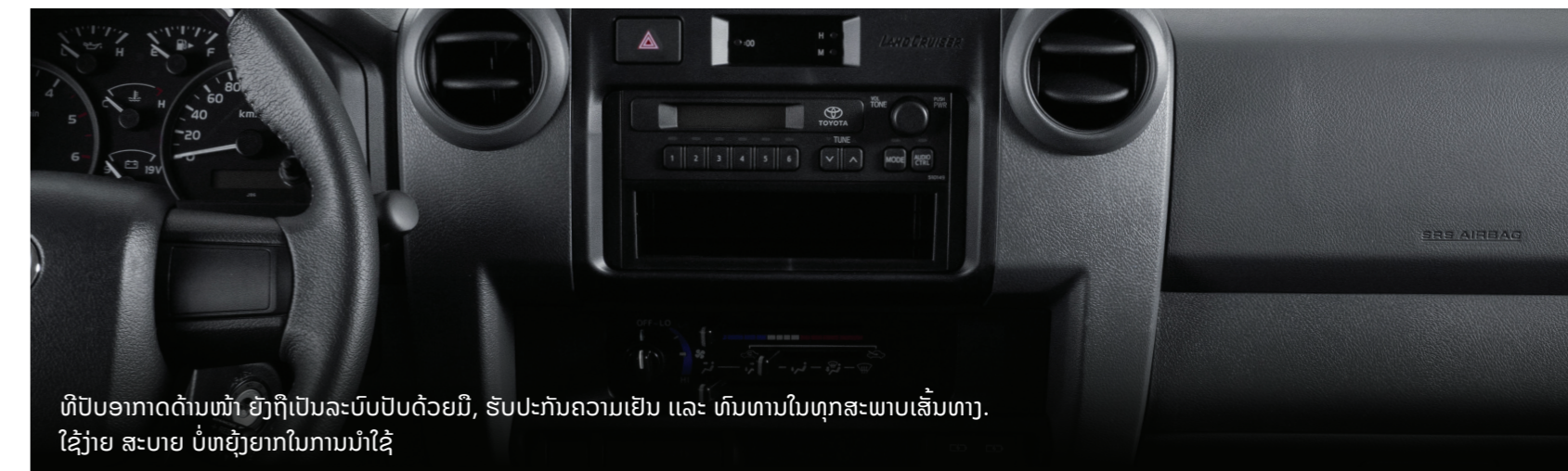
ທີປັບອາກາດດ້ານໜ້າ ຍັງຖືເປັນລະບົບປັບດ້ວຍມື, ຮັບປະກັນຄວາມເຢັນ ແລະ ທົນທານໃນທຸກສະພາບເສັ້ນທາງ. ໃຊ້ງ່າຍ ສະບາຍ ບໍ່ຫຍຸ້ງຍາກໃນການນໍາໃຊ້