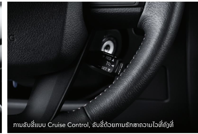
ການຂັບຂີ່ແບບ Cruise Control, ຂັບຂີ່ດ້ວຍການຮັກສາຄວາມໄວທີ່ຄົງທີ່