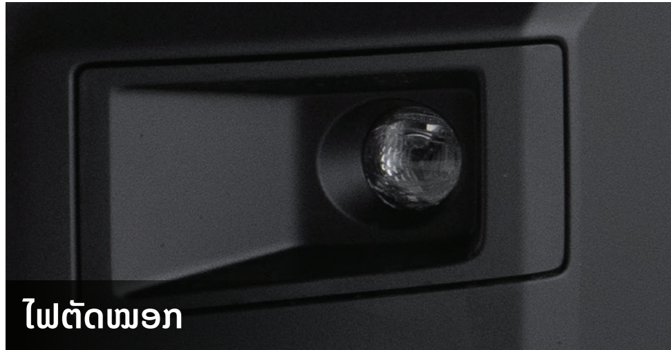
ໄຟຕັດໝອກ

ທໍ່ອາກາດ Snorkel ຊ່ວຍປົກປ້ອງເຄື່ອງຈັກຂອງຍານພາຫະນະຈາກການລຸຍນ້ຳ ແລະ ຝຸ່ນ, ແລະ ສະຫນອງການເຂົ້າເຖິງອາກາດທີ່ສະອາດເຂົ້າໄປໃນເຄື່ອງຈັກ.