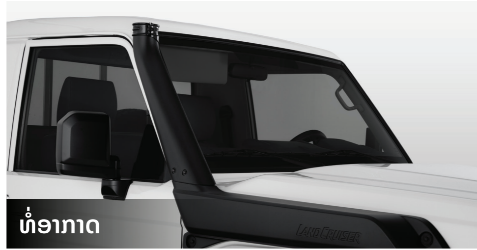
ທໍ່ອາກາດ

ຕາໄຟດ້ານໜ້າອອກແບບເປັນຮູບຊົງວົງມົນ, ນຳໃຊ້ເປັນຫຼອດ Halogen ແຈ້ງສະຫວ່າງ ແລະ ການເບິ່ງເຫັນທີ່ດີຍິ່ງຂຶ້ນບໍ່ວ່າຈະໃຊ້ຕາມເສັ້ນທາງທຳມະດາ ຫຼື ໃນພື້ນທີ່ໝອກສູງ.