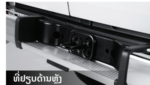
ທີ່ຢຽບດ້ານຫຼັງ

ທີ່ຢຽບດ້ານຫຼັງແມ່ນການເສີມທີ່ເໝາະສົມສຳລັບຍານພາຫະນະທີ່ສູງ ເພື່ອໃຫ້ສາມາດເຂົ້າໄປໃນພື້ນທີ່ດ້ານຫຼັງໄດ້ງ່າຍຂຶ້ນ. ມາພ້ອມກັບຂໍເກາະໄວ້ດຶງ ແລະ ລາກແກ່ໄວ້ຍາມຕ້ອງການ.