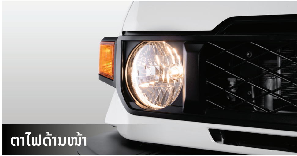
ຕາໄຟດ້ານໜ້າ

ຕາໄຟດ້ານໜ້າອອກແບບເປັນຮູບຊົງວົງມົນ, ນຳໃຊ້ເປັນຫຼອດ Halogen ແຈ້ງສະຫວ່າງ ແລະ ການເບິ່ງເຫັນທີ່ດີຍິ່ງຂຶ້ນບໍ່ວ່າຈະໃຊ້ຕາມເສັ້ນທາງທຳມະດາ ຫຼື ໃນພື້ນທີ່ໝອກສູງ.