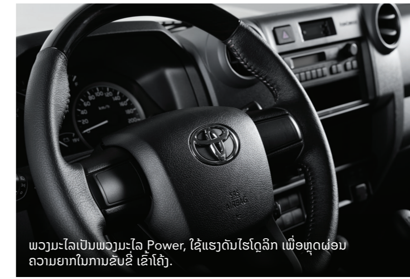
ພວງມະໄລເປັນພວງມະໄລ Power, ໃຊ້ແຮງດັນໄຮໂດຼລິກ ເພື່ອຫຼຸດຜ່ອນຄວາມຍາກໃນການຂັບຂີ່ ເຂົ້າໂຄ້ງ.