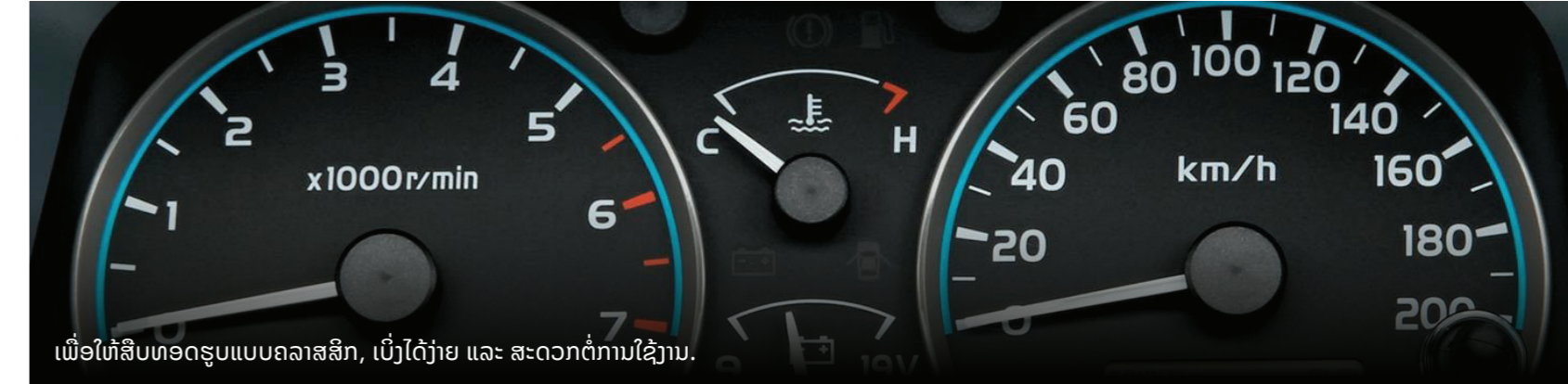
ເພື່ອໃຫ້ສືບທອດຮູບແບບຄລາສສິກ, ເບິ່ງໄດ້ງ່າຍ ແລະ ສະດວກຕໍ່ການໃຊ້ງານ.