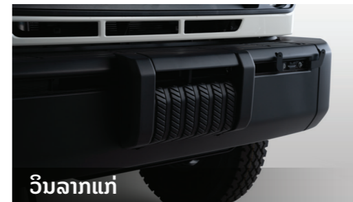
ວິນລາກແກ່

ທີ່ຢຽບດ້ານຫຼັງແມ່ນການເສີມທີ່ເໝາະສົມສຳລັບຍານພາຫະນະທີ່ສູງ ເພື່ອໃຫ້ສາມາດເຂົ້າໄປໃນພື້ນທີ່ດ້ານຫຼັງໄດ້ງ່າຍຂຶ້ນ. ມາພ້ອມກັບຂໍເກາະໄວ້ດຶງ ແລະ ລາກແກ່ໄວ້ຍາມຕ້ອງການ.